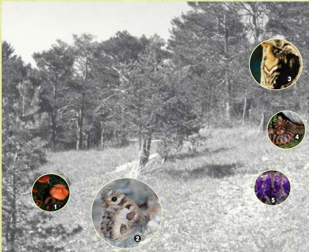
❶ Ziegelroter Saftling ( Hygrocybe perplexa ); ❷ Berghexe oder Felsenfalter ( Chazara briseis ); ❸ Wiedehopf ( Upupa epops ); ❹ Aspiviper ( Vipera aspis ); ❺ Österreichischer Drachenkopf ( Dracocephalum austriacum )

Massnahmen zur Erhaltung und Förderung der wichtigsten Arten in Trockenwiesen und -weiden sollen verstärkt werden. Mögliche Handlungsebenen: Pflegepläne, Verträge, spez. Artenschutzmassnahmen, Aktionspläne.